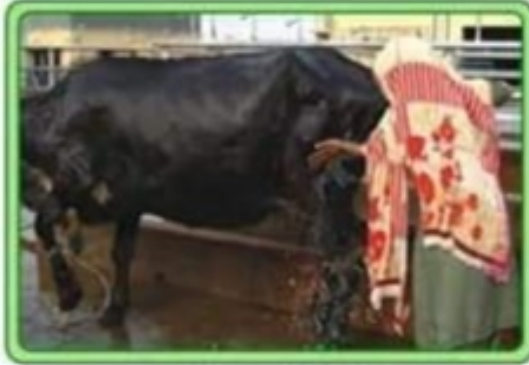
جانور کو اچھی طرح صاف کریں