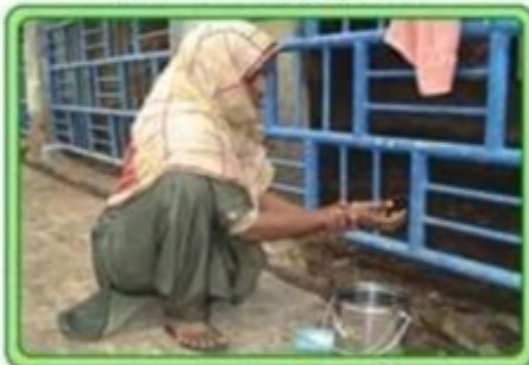
پوائی سے پہلے ہاتھ اچھی طرح دھوئیں