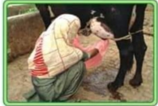
حوانے کو دھو کر اچھی طرح خشک کر لیں