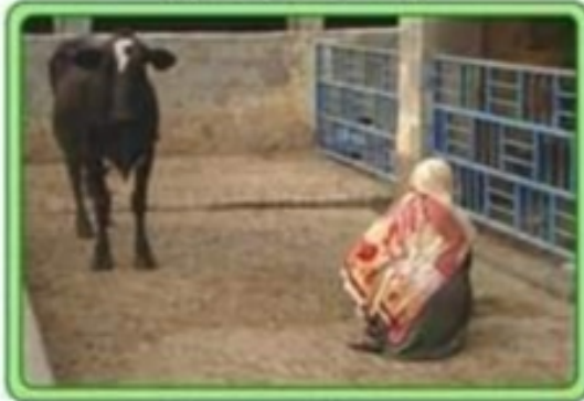
دو دنے والی جگہ صاف اور خشک ہو