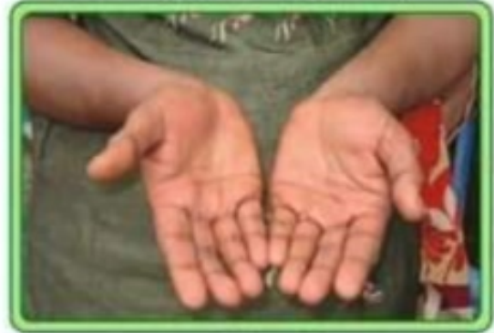
ہاتھ دھونے کے بعد