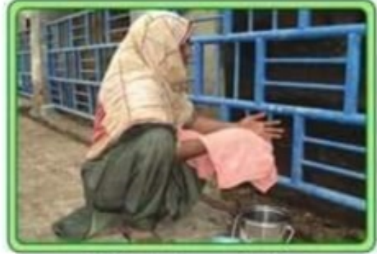
ہاتھ صاف کپڑے سے اچھی طرح خشک کریں